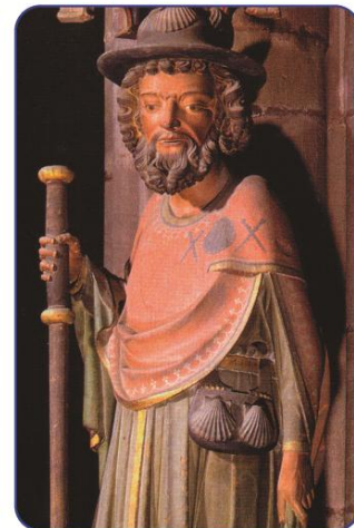
Paulus und Jakobus begrüßen im Freiburger Münster die eintretenden Pilger auf dem Himmelreich – Jakobusweg.

Als „Säulen“ des Christentums stehen sie einander gegenüber an je einer Säule.