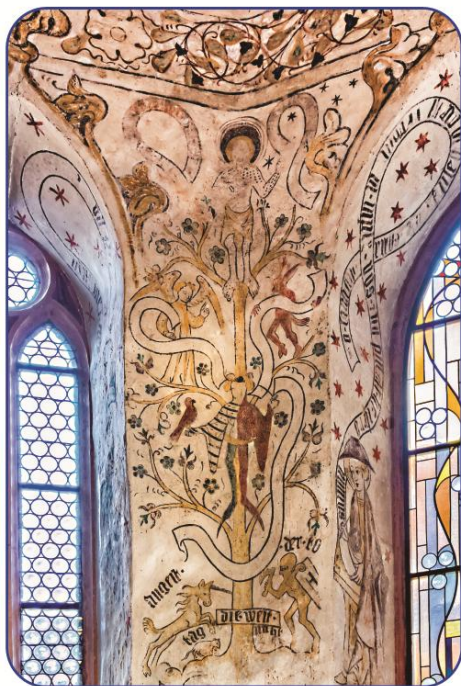
Lebensbaum in der St. Laurentius-Kirche in Bischoffingen

Es zählt nicht, wo du herkommst, es zählt nur, wo du hin willst.